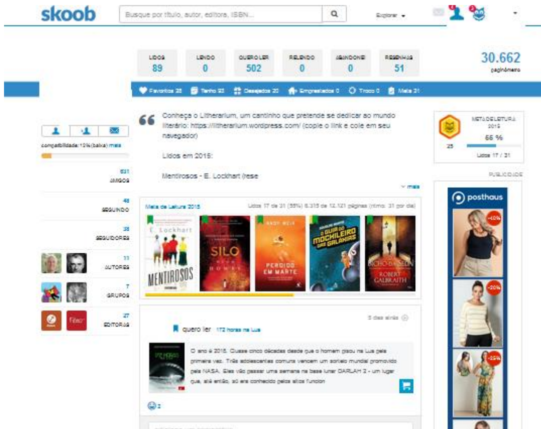
Figura 2: página de um usuário do Skoob

O Skoob , assim como outras redes sociais especializadas, é reflexo da cibercultura, que, segundo Pierre Lévy (1999, p. 30),