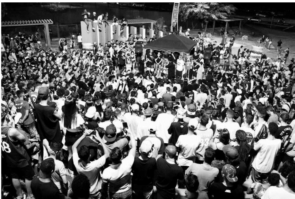
Figura 01. Batalha do Vale acontecendo na Praça do Vale.

Já a Batalha do Vale, por sua vez, é um coletivo cultural independente que atua em Presidente Prudente e nas cidades menores da região desde 2015, através de ações culturais ligadas as vertentes artísticas e políticas do Hip Hop. Ao longo de seus anos de atividade, a BDV se apropriou da Praça “Oscar Figueiredo Filho”, mais conhecida como Praça do Vale pelas juventudes periféricas da cidade e por isso o nome do coletivo, sendo que a batalha de Mcs é o mais divulgado e conhecido evento realizado pelo coletivo. Além destas ações culturais realizadas em espaço público, a Batalha do Vale realiza atividades em escolas públicas da região de Presidente Prudente, com o objetivo de atingir as gerações mais novas com os princípios educacionais da cultura Hip Hop.