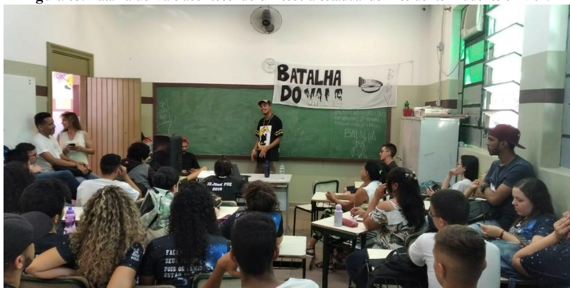
Figura 03. Batalha do Vale acontecendo em escola estadual de Presidente Prudente em 2019.