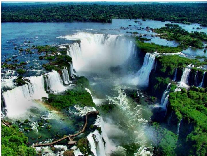
Figura 3. Cataratas do Iguaçu