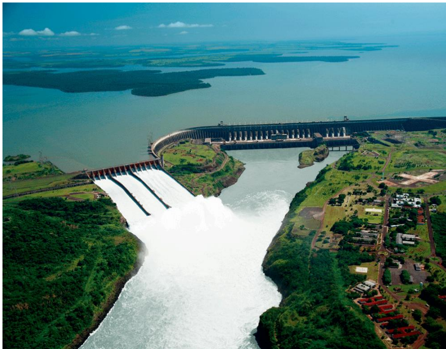
Figura 4. Usina Hidrelétrica de Itaipu

concluída em 6 de maio de 1991, quando entrou em funcionamento o 18º gerador. No ápice da obra chegou-se a ter 40 mil trabalhadores.