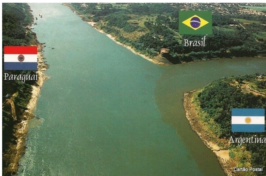
Figura 2. Marco das Três Fronteiras

presentes nestes três países e que começam a fazer parte da vida das pessoas que vivem nesta região (CARNEIRO, 2016).