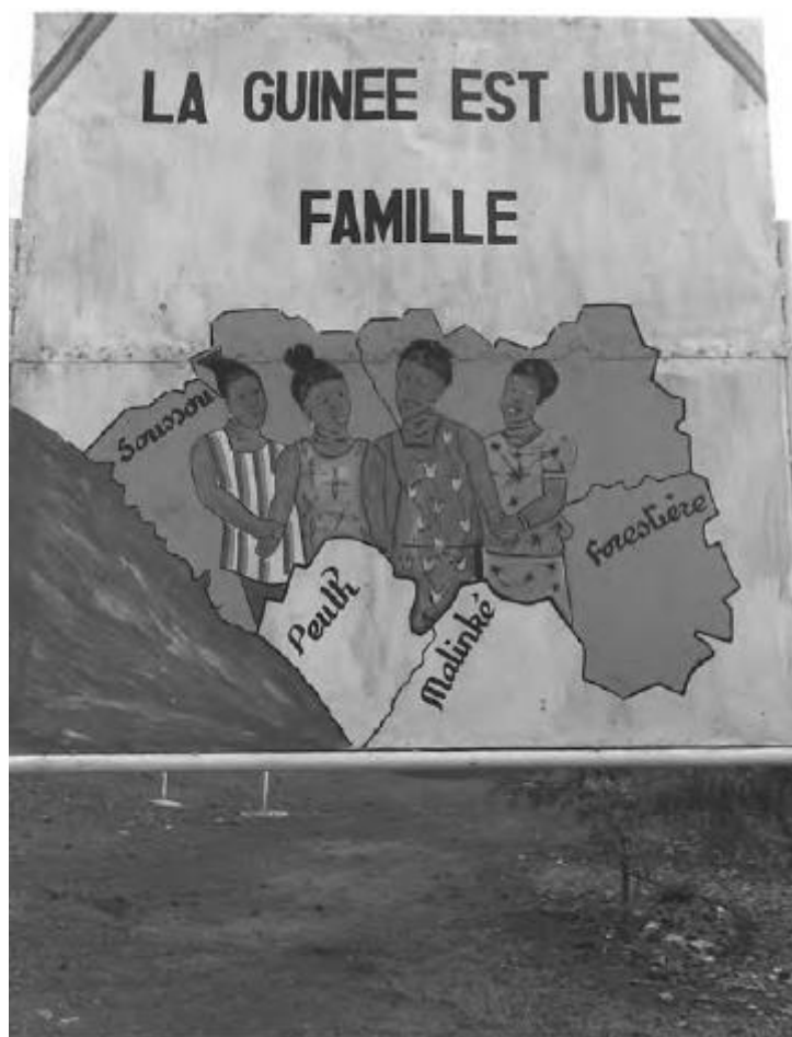
2. Uma representação da Guiné, Conacri, 2008.