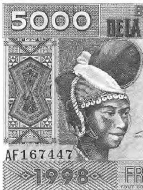
4. Uma ilustração em circulação: a “mulher com crista” no papel-moeda.