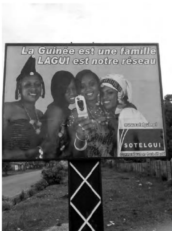
1. Outdoor da campanha publicitária de telefone Sotelgui, Conacri, 2008.

A apropriação por intermédio da publicidade dessas categorias banaliza os estereótipos, veicula as mensagens implícitas para todos os guineenses e pode contaminar a política. Depois do malinquê Sekou Toure e o susu Lansana Conte, a aquisição de poder pelo guarda florestal Moussa Dadis Camara, no final de 2008, foi percebido como uma alternância lógica, na espera da chegada da quarta força ao poder 57 .