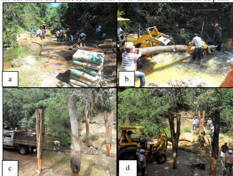
Fotografia 4 – Assentamento Olga Benário/Ipameri (GO): mutirão para construção de uma ponte: a) e b): Início dos trabalhos; c) Erguimento das hastes da ponte; d) Conclusão do levantamento das hastes da ponte

Nesse sentido, é importante pontuar algumas das dificuldades enfrentadas pelas famílias do Assentamento Olga Benário: a) necessidade de assalariamento na cidade de Ipameri ou nas propriedades rurais vizinhas ao assentamento, tempo que poderiam se dedicar ao trabalho no lote familiar; b) as famílias não possuem a Declaração de Aptidão ao PRONAF (DAP); c) as famílias não acessaram o Programa Nacional de Fortalecimento da Agricultura Familiar (PRONAF); d) o assentamento possui as instalações físicas de uma escola, porém, ela não funciona; e) ausência de postos de saúde; f) carência de assistência técnica; g) necessitam de estradas em melhores condições; h) ausência de projetos de lazer para as famílias assentadas, especialmente os jovens. Diante disso, em algumas ocasiões, as famílias (ou parte delas) organizaram-se para desempenhar alguns serviços no assentamento. Por exemplo, no ano de 2011, realizaram a construção de uma ponte, por meio de mutirão (trabalho conjunto) (Fotografia 4).