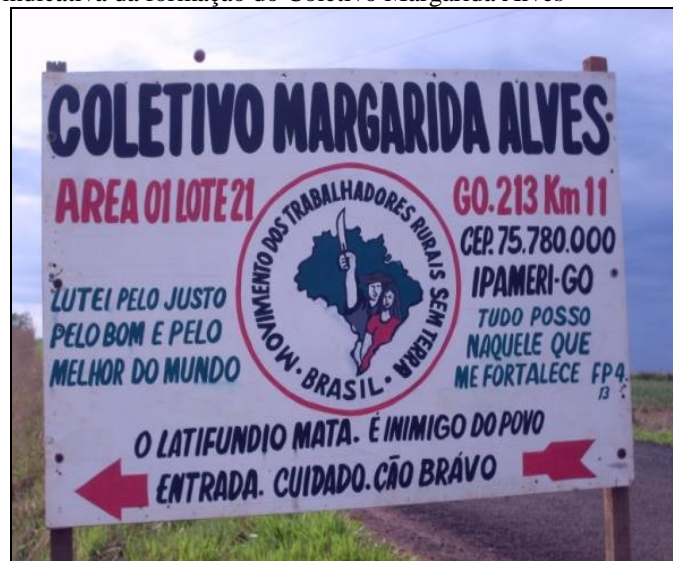
Autor: MONTEIRO, R. de M. (2009)

Depois da sua criação, o Coletivo Margarida Alves arrendou parte de suas terras para produção de soja como uma estratégia de obtenção de renda para futuros investimentos produtivos do grupo. Esse fato tornou-se um ponto nevrálgico para que as demais famílias que, apesar de não participarem do grupo semicoletivo, permaneciam no MST, rompessem com o Movimento e fundassem a Associação dos Pequenos Produtores do Assentamento Olga Benário (ASPRAOB) (Fotografia 2). Na época, uma das materializações do descontentamento das famílias com as ações do Coletivo Margarida Alves revelou-se com a pichação da placa indicativa da localização do assentamento com a seguinte frase: “Aqui produz soja transgênica” (Fotografia 3).