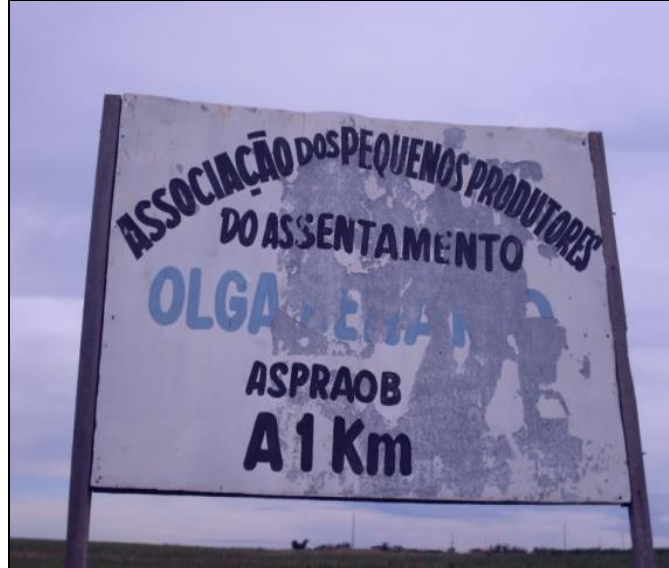
Autor: MONTEIRO, R. de M. (2009)