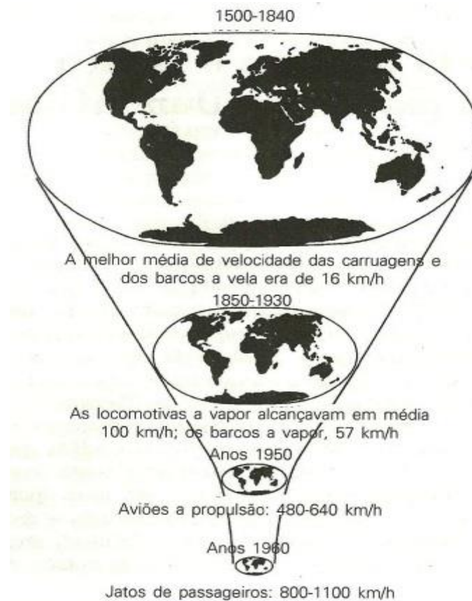
Figura 3 – O encolhimento do mundo mediante a inovação dos transportes.

Mas esse encurtamento no tempo não está somente verificado no que tange a comunicação através da internet e do uso do celular. Se formos realizar uma análise histórica, iremos destacar que a modernização da locomoção também se tornou fator principal para que pudéssemos conferir como o tempo também tem se encurtado na dinâmica diária da população, conforme a figura 3 destaca: