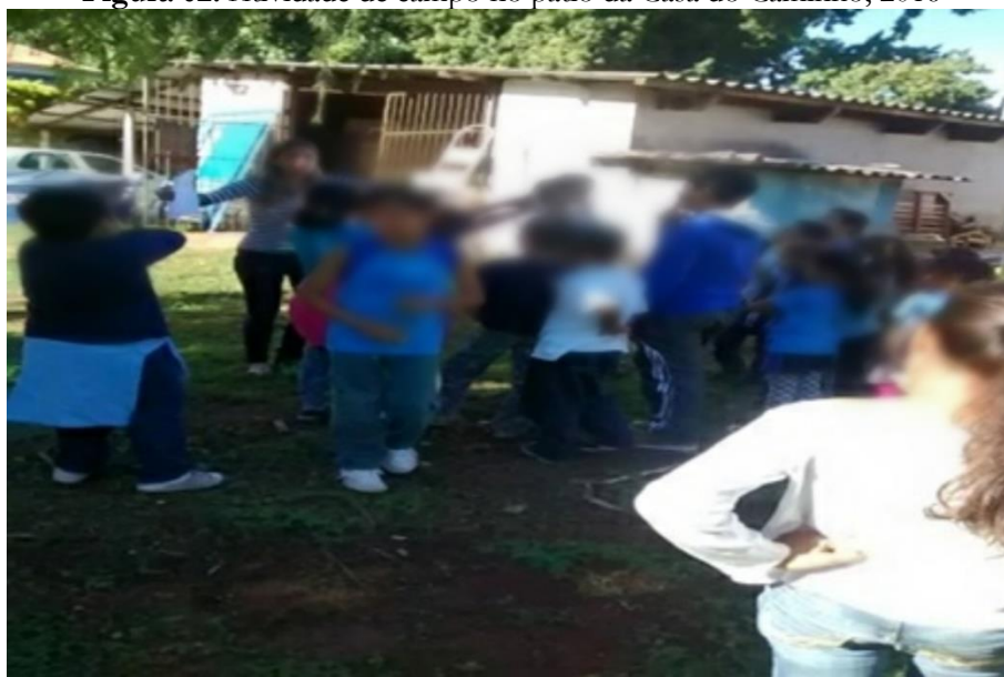
Figura 02. Atividade de campo no pátio da Casa do Caminho, 2016

Durante essa atividade no pátio (Figura 02), o que mais chamou a atenção de parte dos educandos foi a presença de entulhos em determinada parte da instituição. Para algumas crianças foi perceptível que aquela cena não os chocou, pois fazia parte do seu cotidiano, verificarem restos de mobília, de construção civil descartados, já para outros alunos, aquele fato era considerado poluído.