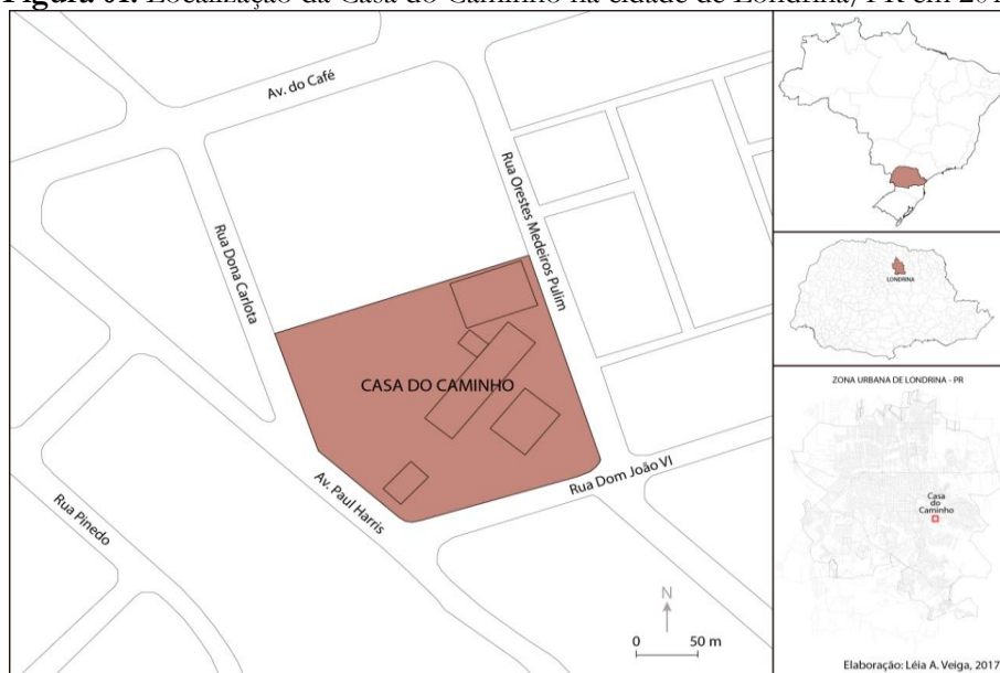
Figura 01. Localização da Casa do Caminho na cidade de Londrina/PR em 2017