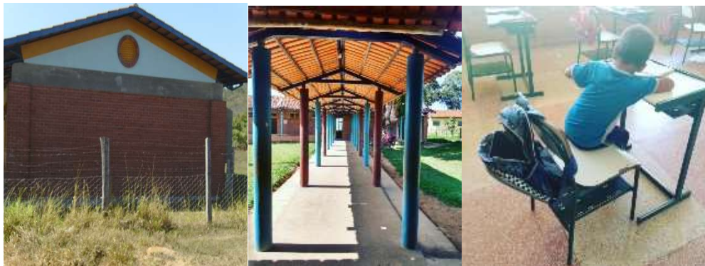
Figura 2. Imagens parciais da Escola Estadual Indígena Cacique José Borges, aldeia Carretão, 2019

A Escola Indígena, foi construída no mesmo modelo das escolas não indígenas, salas com carteiras em fileiras, quadro e mesa para o professor. Esse modelo acabou sendo pouco discutido pela comunidade, que aceitaram sem muitos questionamentos, devido a urgência de se ter uma escola na aldeia, como mostra a Figura 2: