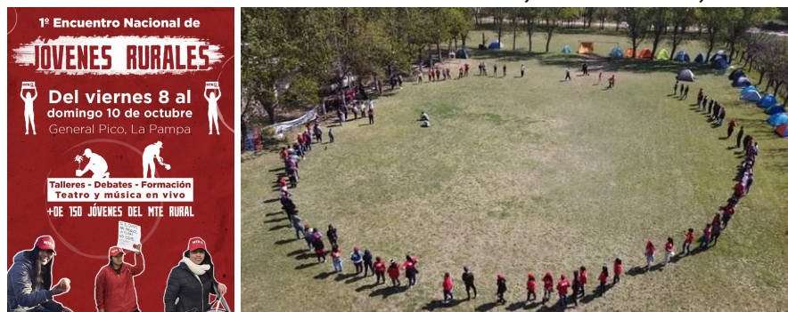
Imagen 8: Encuentro Nacional de Jóvenes Rurales, General Pico, octubre 2021.