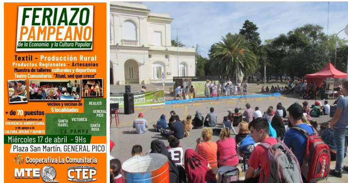
Imagen 6: Feriado Pampeano, en Plaza San Martín, General Pico, abril 2019.