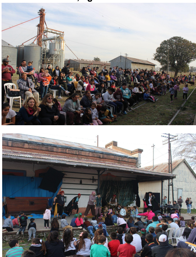
Imagen 1: Obra de teatro en la sede de González Moreno, con motivo del mes de la niñez, agosto 2022.