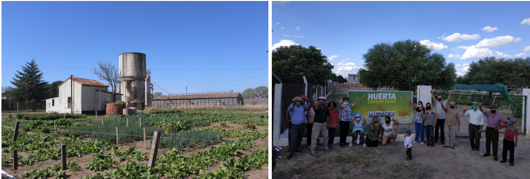
Imagen 7: Huertas comunitarias en González Moreno y en Santa Isabel.