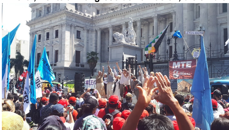
Imagen 2: Obra de teatro sobre las luchas chacareras en el marco de una protesta del MTE-Rural, frente al Congreso de La Nación, diciembre 2021.