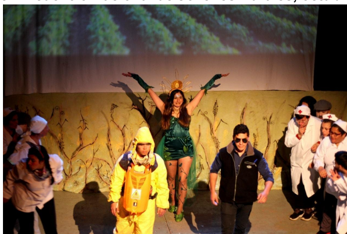
Imagen 3: Escena de “Se cayó el sistema, disculpe las molestias”, presentada en el marco del Encuentro Nacional de Jóvenes Rurales, octubre 2021.

A la izquierda de la fotografía se aprecia un fumigador, en el medio “la porota” representando la soja que causa fascinación en el pequeño productor y a la derecha el técnico que promueve esta tecnología (notas de campo, Encuentro Nacional de Jóvenes Rurales, oct 2021).