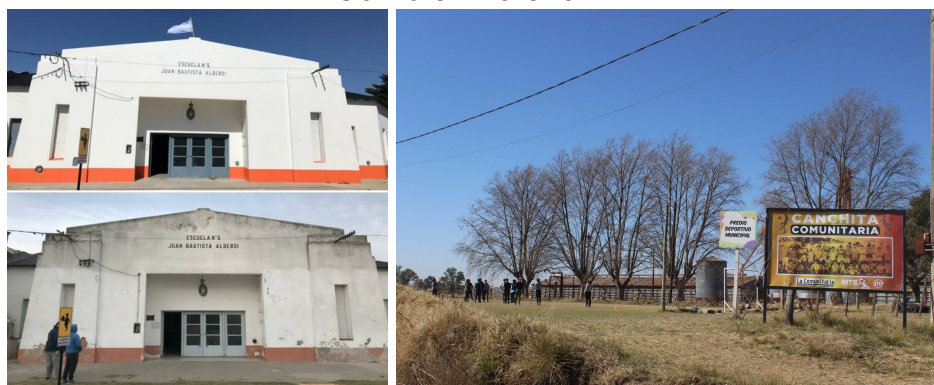
Imagen 5: Escuela N°5 refaccionada en Fortín Olavarría y cancha de fútbol en González Moreno.