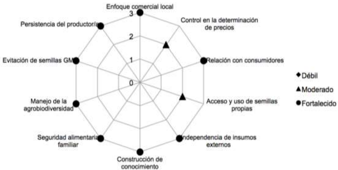
Figura 3: Valoración cualitativa del efecto sobre la soberanía alimentaria local del sistema agroecológico en Samaipata, Santa Cruz