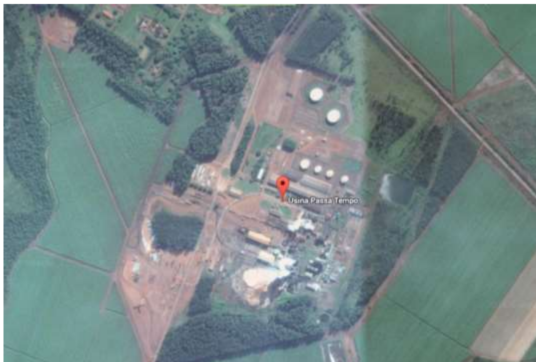
Figura 1: Foto aérea da unidade Passa Tempo em Rio Brilhante