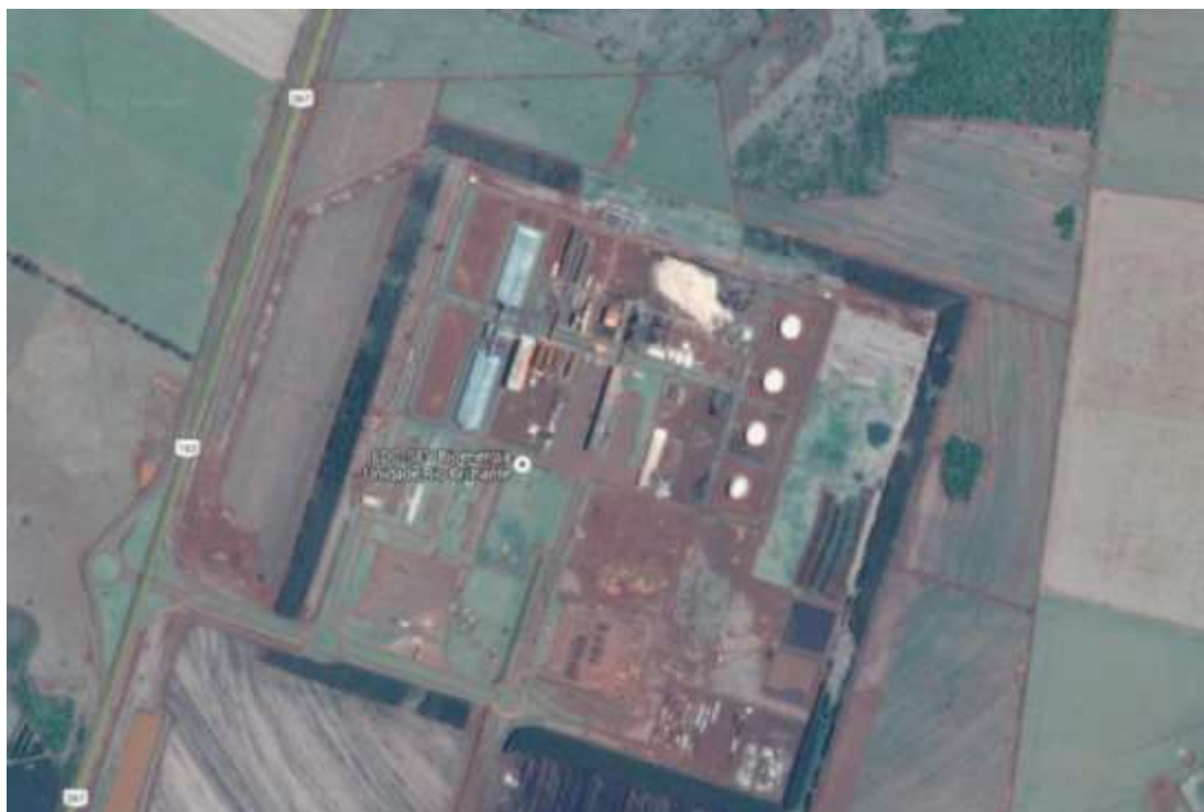
Figura 2: Foto aérea da unidade Rio Brilhante pertencente à LDC