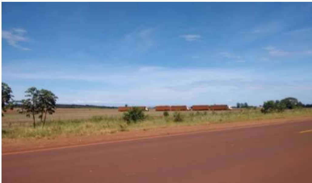
Figura 3: Caminhão com carregamento de cana-de-açúcar da usina LDC em Rio Brilhante.

A figura 3 apresenta o carregamento de cana-de-açúcar com produção da LDC em Rio Brilhante, que tem um fluxo continuo nos assentamento e estradas do município.