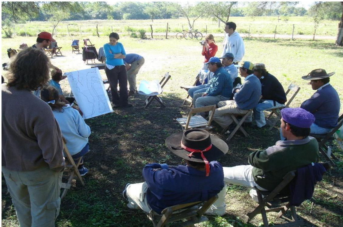
Foto 3: Reconociendo el territorio campesino, Reserva Limitas, Paraje Las Limitas, 2011