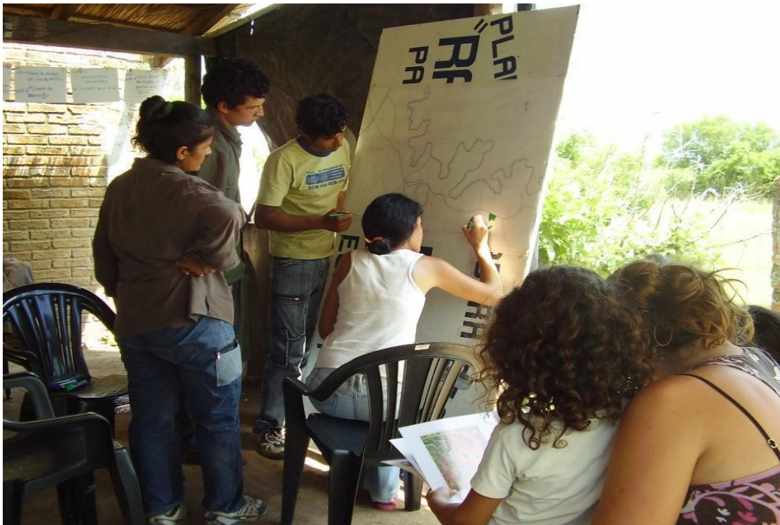
Foto 2: Delimitando el territorio de la comunidad, Reserva La Roca, Paraje Las Rozas, 2010