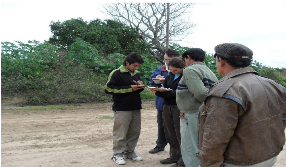
Foto 4: Recorrido territorial, Reserva La Roca, Paraje Las Rozas, 2010