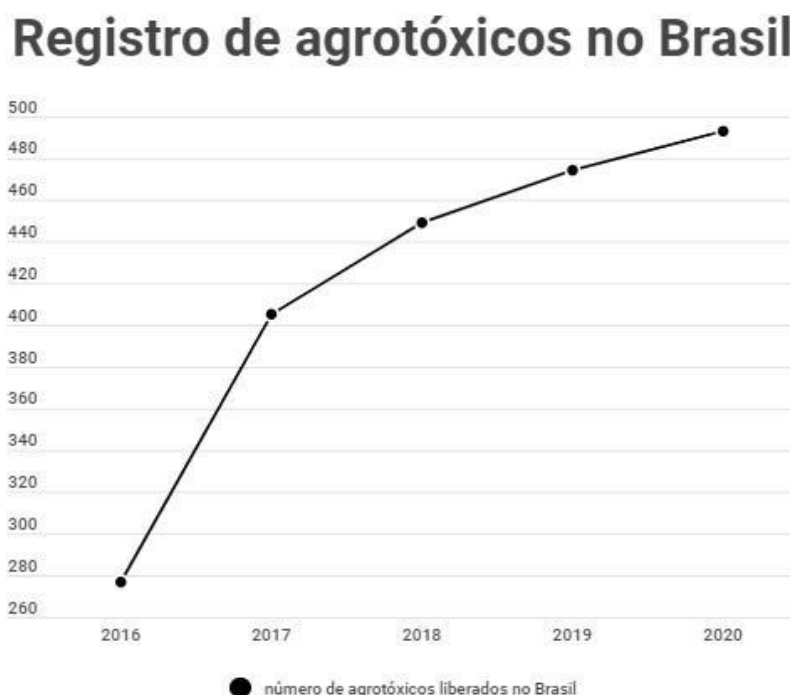
Figura 03: O registro de agrotóxicos no Brasil (2016-2020) 7