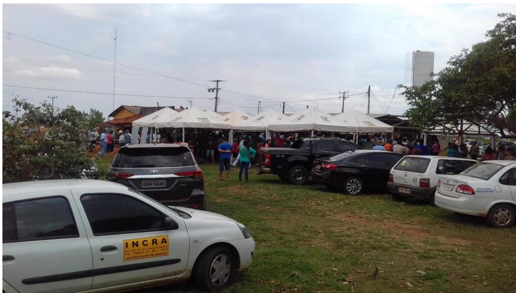
Figura 7: Entrega de Contratos de Concessão de Uso (CCUs) no Assentamento Teijin.

Dentre as lideranças políticas presentes, vale ressaltar que poucos membros foram atuantes no período de luta pela conquista de terra no Assentamento Teijin. O político mais lembrado por nossos participantes sequer estava presente (o governador da época, Zeca do PT). Uma observação realizada pelo assentado TJ1 é referente à assistência ou frequência de atendimento pelo INCRA, que, após a desapropriação, não haviam visitado o assentamento. A Figura 7 ressalta a grande movimentação que a entrega dos CCUs proporcionou ao Assentamento Teijin.