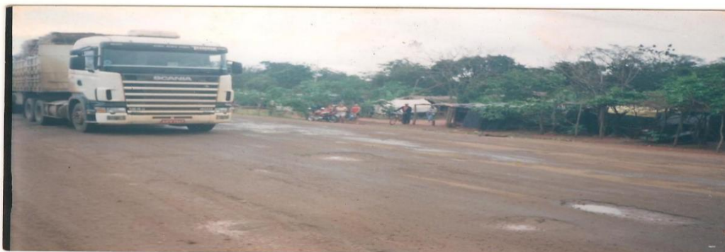
Figura 4: Vista parcial do Acampamento 17 de Abril, na rodovia MS-134.