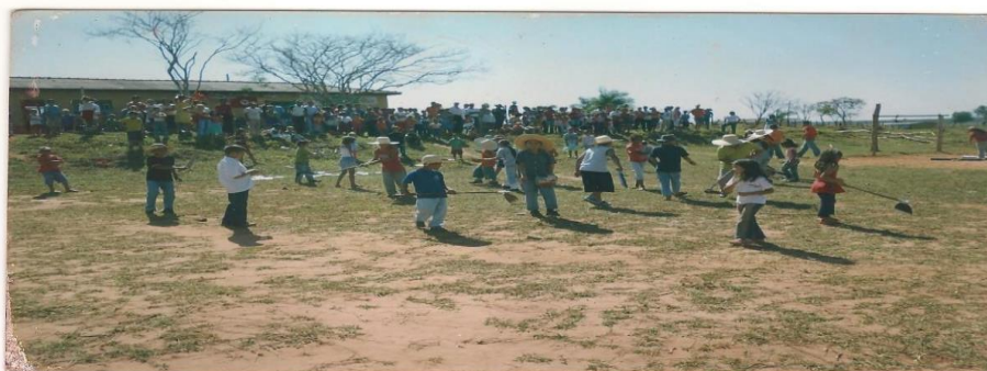
Figura 6: Escola para os filhos dos assentados dentro da Fazenda Teijin em 2005.