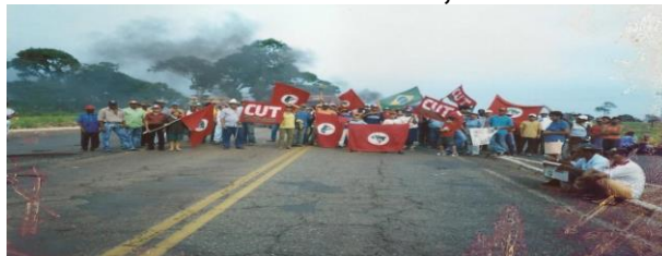
Figura 3: Mobilizações do MST, CUT 5 e FETAGRI nas rodovias federais e estaduais no Estado de Mato Grosso do Sul, no ano de 2003.

Fonte: Acervo pessoal do assentado TJ1 (paralisação na BR-267, no município de Nova Andradina – rodovia que liga Bataguassu a Nova Alvorada do Sul no ano de 2003).