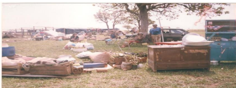
Figura 5: Primeiro acampamento dentro da Fazenda Teijin em 2004.