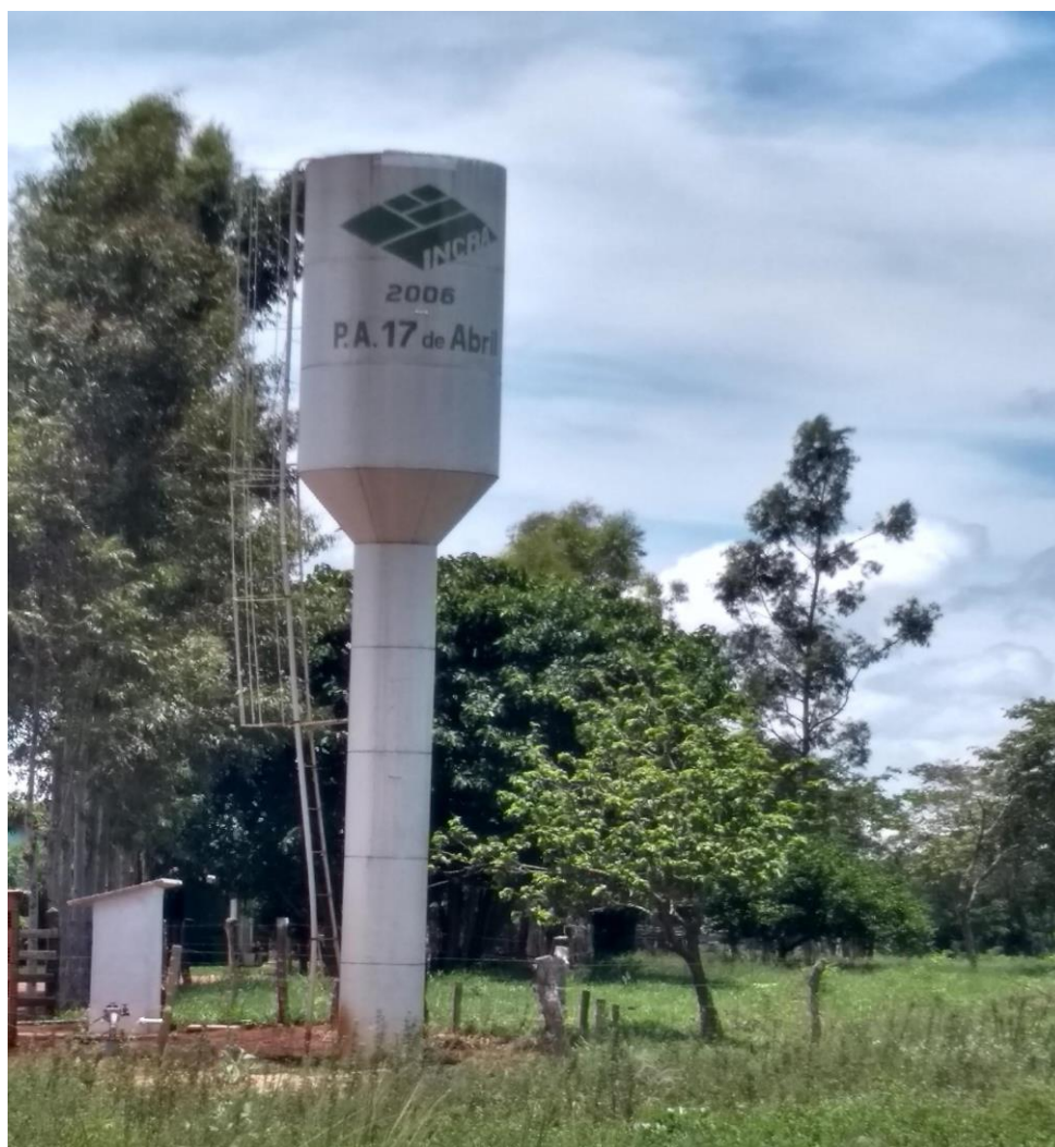
Figura 2: Reservatórios de água instalados no Assentamento Teijin.