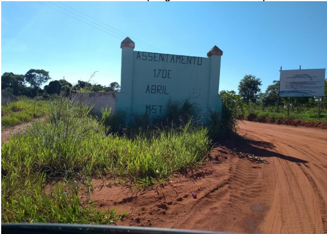
Figura 1: Uma das entradas principais do Assentamento Teijin no município de Nova Andradina/MS (margens da rodovia MS-134).

do Assentamento Teijin, que dá acesso aos lotes ligados ao MST, existe um título na antiga entrada da propriedade, como “Assentamento 17 de abril”, conforme a Figura 1.