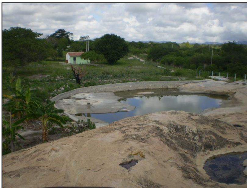
Tanque em fenda de rocha na Comunidade de Fava de Cheiro em Teixeira-PB. 13/01/2011.

A introdução dessas tecnologias sociais nas unidades de produção camponesas, principalmente das cisternas de placas, tem reduzido a incidência de doenças e ainda vem gerando renda para alguns camponeses que aprenderam a construí-las e vêm