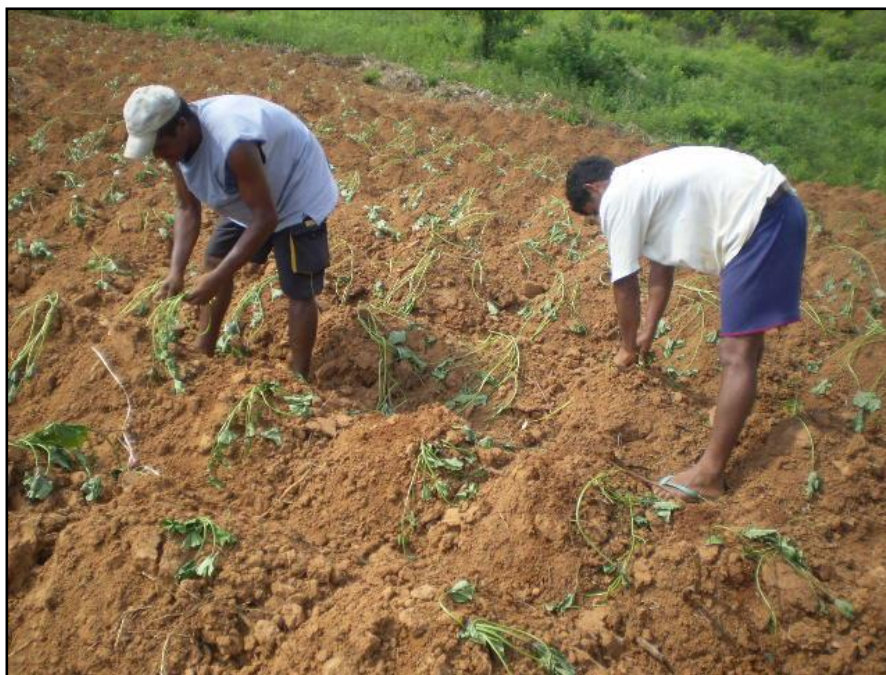
Pai e filho trabalhando no plantio da batata-doce no Assentamento Poços de Baixo em Teixeira-PB. 13/03/2008.

A participação dos membros da família nas tarefas agrícolas é muito valorizada nas unidades de produção camponesas. Geralmente, cabem aos homens e aos mais jovens as tarefas mais pesadas realizadas no roçado, como o corte do mato, o encoivramento, a destoca e a colheita. As mulheres e os filhos que ainda não estão em idade de executar trabalho pesado cuidam das tarefas domésticas e de trabalhos mais leves tais como: cuidar das crianças pequenas; cuidar dos animais de pequeno porte; limpar a casa e o terreiro; lavar as roupas; preparar a alimentação da família, além de outros.