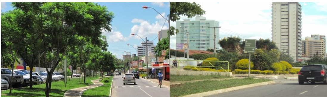
Figuras 5 e 6 – Avenida Olívia Flores, Bairro Candeias – Vitória da Conquista/BA, 2016.

bairros/locais diferenciados – em seu conteúdo de classe, onde alguns são providos dos equipamentos urbanos necessários (Figuras 5 e 6) e outros, desprovidos (Figuras 7 e 8).