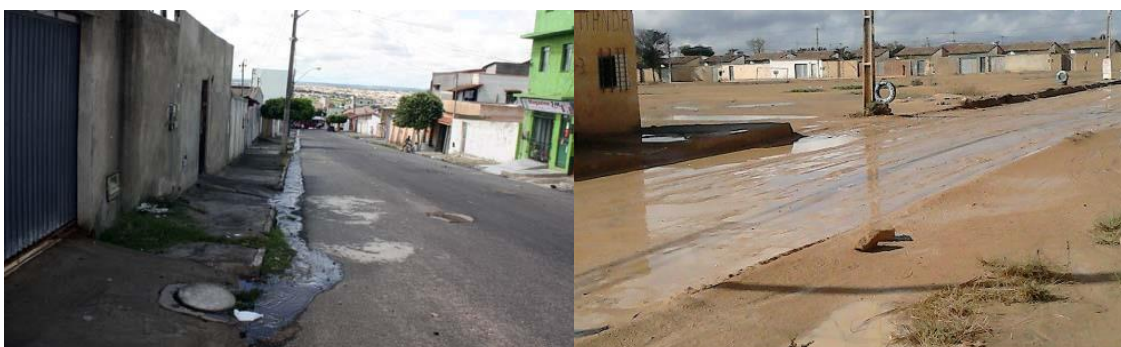
Figuras 7 e 8 – Rua do Bairro Alto Maron e Rua do Conjunto Vila América – Bairro Boa Vista – Vitória da Conquista/BA