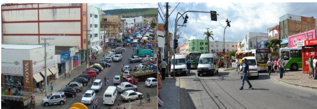
Figuras 3 e 4 – Vitória da Conquista/BA - Áreas Comerciais - Centro - Terminal de ônibus e Bairro Brasil, 2016.

A cidade de Vitória da Conquista vai sendo produzida à medida que começa a se especializar na prestação de serviços, em várias áreas, como saúde e educação, bem como pela intensificação das atividades comerciais (Figuras 3 e 4). Cresce também a necessidade de moradias para a população, embora essa se estabeleça de modo diferenciado entre os sujeitos/classes existentes na sociedade. Nesse processo, a forma de parcelamento da terra vai acontecendo de forma a não contemplar as necessidades da população mais pobre, que, diante da realidade vivenciada, começa a reivindicar sua participação na formação desse espaço através da luta por moradia – evidenciando a luta de classe no espaço da cidade.