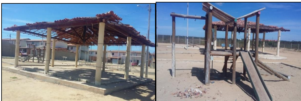
Figuras 12 e 13 – Equipamentos urbanos instalados no Vila do Sul e Vila Bonita – Vitória da Conquista/BA, 2016.