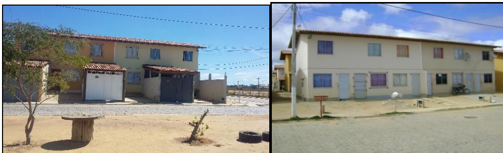
Figuras 10 e 11 – Villages Vilas do Sul e Vila Bonita, imagem à esquerda com alterações de infraestrutura e imagem à direita sem alterações – Vitória da Conquista/BA, 2016.

especial, os conjuntos habitacionais Villa do Sul e Vila Bonita, viabilizados pelo Programa Federal de Habitação Minha Casa, Minha Vida e suas parcerias com os governos estadual e municipal. (Figura 10, 11, 12 e 13).