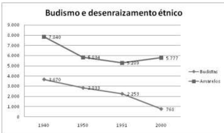
Figura 2: Correlação entre número de nikkeis e os praticantes do Budismo de cor amarela em Presidente Prudente.

Ao desembarcar nas estradas de ferro da região de Presidente Prudente, os japoneses eram “virtualmente budistas”. Isto por dois motivos: primeiro, porque o Budismo confunde-se com a niponicidade 12 dos imigrantes (ou seja, era uma religião definidora de seu pertencimento étnico); em segundo, pelo fato de que os imigrantes eram procedentes de regiões no Japão onde predominava o Amida-Budismo. 13