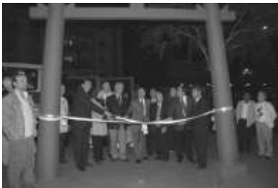
Figura 1: Portal é inaugurado na Praça das Cerejeiras (Presidente Prudente), em 18 de junho de 2008 em comemoração ao centenário da imigração.

principais marcos da inserção do Budismo étnico em nossa área de estudo, passando depois a avaliar suas tendências apresentadas ao longo do tempo, bem como os traços mais relevantes da religiosidade nikkei na atualidade. Para tanto, utilizaremos dados do Instituto Brasileiro de Geografia e Estatística (IBGE), sobretudo provenientes de censos demográficos.