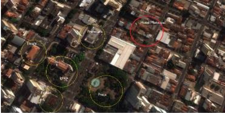
Figura 2: O Hotel Municipal e núcleo histórico inicial