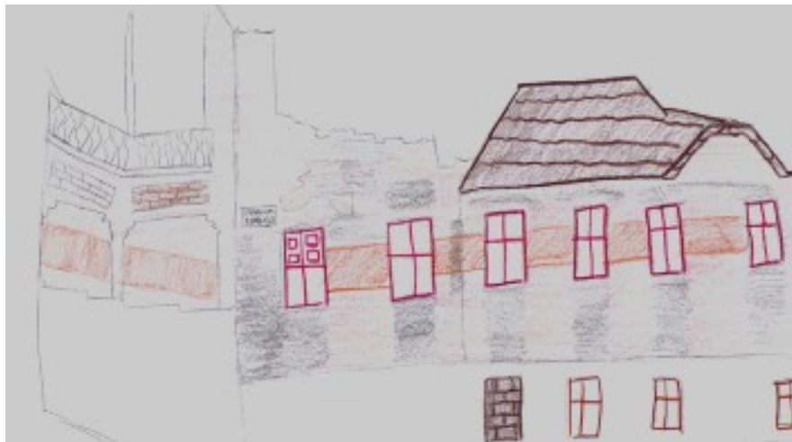
Figura 1. Desenho das ruínas do Hotel Municipal.

(Figura 1). Apenas paredes externas, que ainda caracterizavam a construção, e um estacionamento descoberto de automóveis ocupam parte do lote. Atualmente, uma construção sem relação com a anterior (Foto 2) surge em substituição, comprometendo o caráter e integridade da edificação e do centro histórico de Presidente Prudente.