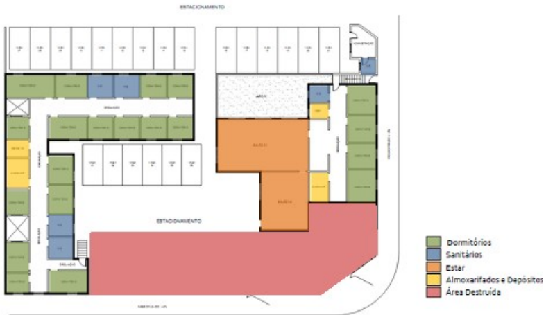
Figura 4: Planta do Hotel Municipal com a parte demolida

No início de 2010, o proprietário começou a reforma do que sobrou da demolição construindo ambientes buscando manter o traçado semelhante ao original. Na parte que faz frente com a Rua Dr. Gurgel, onde atualmente funciona o estacionamento, o projeto contava com a reconstrução do antigo bloco na mesma proporção, porém, no lugar de dormitórios, seriam instalados sete lojas de vestuário, com acesso direto à rua e sem circulação central. Na esquina, que antes abrigava a recepção do hotel, seria instalado um café. Já no segundo pavimento os serviços e administração.